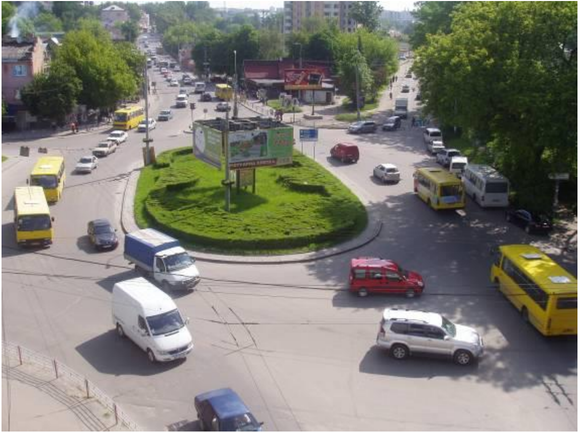
Транспортна розв'язка вулиць Збараської, Бродівської, Галицької у м. Тернопіль (стаціонарний пост спостереження за станом атмосферного повітря № 1)